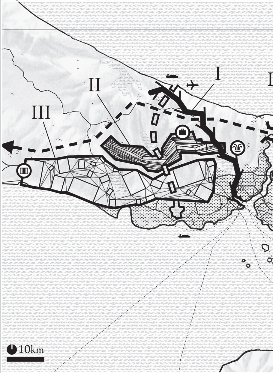
Genel harita (Çizen: Sébastien Mazauric).