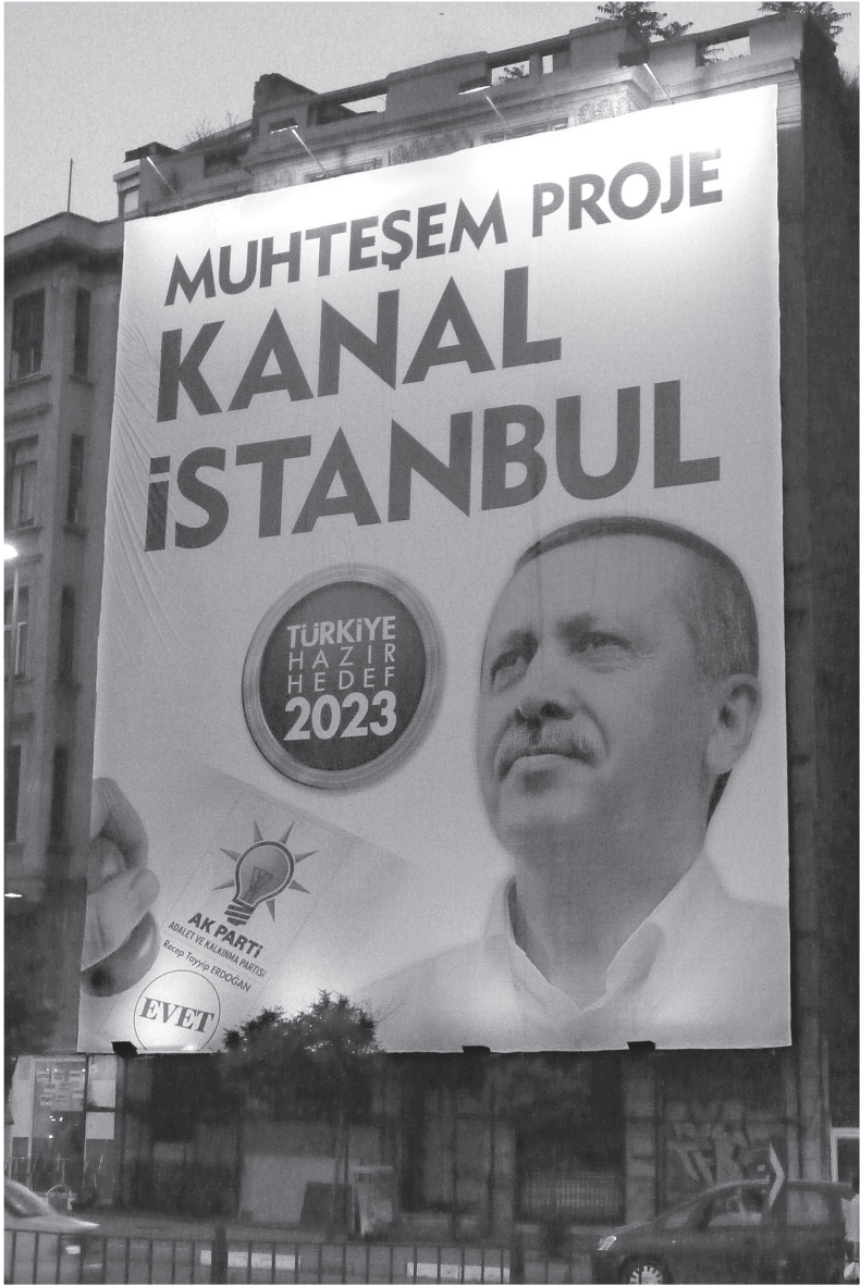
2011 genel seçim kampanyası, Hedef 2023 (Fotograf: Brian Chauvel, Fransız Anadolu Araştırmaları Enstitüsü).