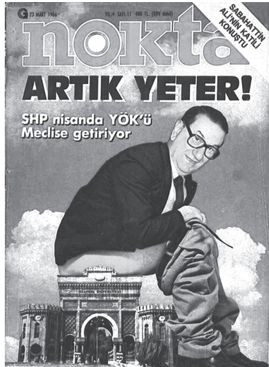
Nokta dergisinin ünlü kapağı.

Bu kapağı görmüş ve dört yaşımın verdiği ekstra ilgiyle hafızama işle-