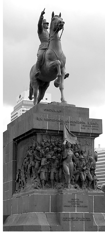
Resim 23: İzmir Atlı Atatürk Anıtı, Pietro Canonica (1869-1962), 1932, bronz-mermer, İzmir.

Amıtın kaidesinde neredeyse üç cepheyi kaplayacak biçimde tasarlanmış bir yüksek kabartma kompozisyon yer alır (Resim 24). Kaidenin ön yüzüne, “Ordular, ilk hedefiniz Akdeniz’dir, ileri! Başkumandan Gazi Mustafa Kemal Eylül 1922.” ve “Büyük kurtarıcıya İzmir’in minnet ve şükranı. Kurtuluş: 9 Eylül” ifadesi bronz harflerle yazılmıştır. Kaidenin üstünde duran heykelde Atatürk, mareşal üniformasıyla atının üstündedir, gövdesi ve başı sola dönüktür, sol eliyle atın dizginlerini tutarken, sağ eliyle ileriye gösterir. Sağ ayağı ileri adım atmak üzereyken betimlenmiş olan at tam karşıya bakar. Kaidenin ön cephesinde, yüksek kabartma tekniğiyle çalışılmış, sağ ayağı önde, Türk bayrağı taşıyan, şalvarlı ve beli hançerli bir kadın figürü, hemen arkasında ise askerler ve halk yer alır. Kabartmanın sol cephesinde, Türk ordusunu sevinçle karşılayan İzmir halkı betimlenmiştir. Askeri kucaklamak üzere kollarını açmış başı örtülü bir kadın, savaş dönüşü babalarına kavuşan çocuklar ve oğluna kavuşan bir yaşlı adam figürü, İzmir halkını temsil eder. Kabartmanın sağ cephesinde, Kemalpaşa yolundaki Belkahve mevkiinden ordu İzmir’e yürürken tarihî bir çınar ağacının altındaki bir çeşmeden başkumandanın su içtiği an sahnelenmiştir. Rölyefe ayrıca, cephaneye dolu bir kağıt ve İzmir Körfezi de işlenmiştir. Kaide mekâna hâkim olacak boyutta yüksektir çünkü amıtın yer-